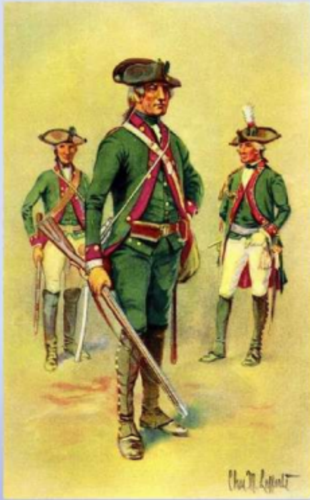
Uniformen der Jäger-Kompanien aus Hessen-Kassel