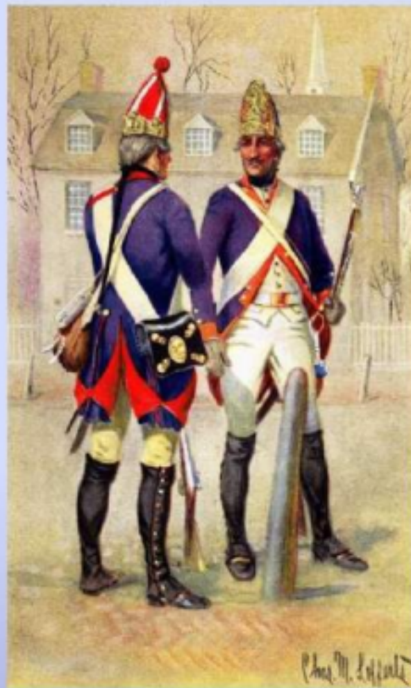
Uniformen der hessischen Grenadier-Bataillone