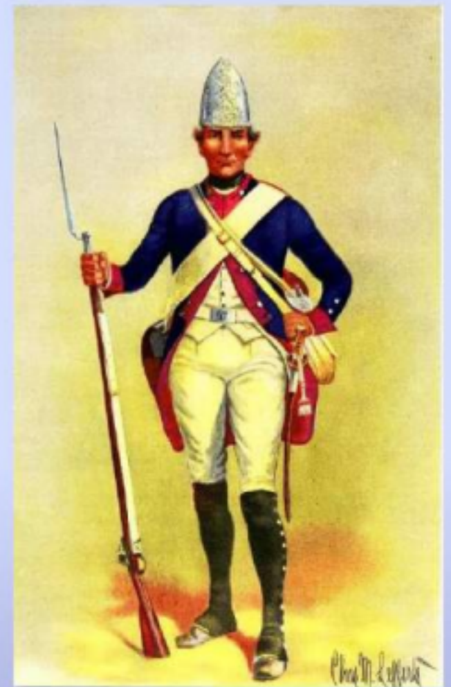
Uniformen der hessischen Füsilier Regimente