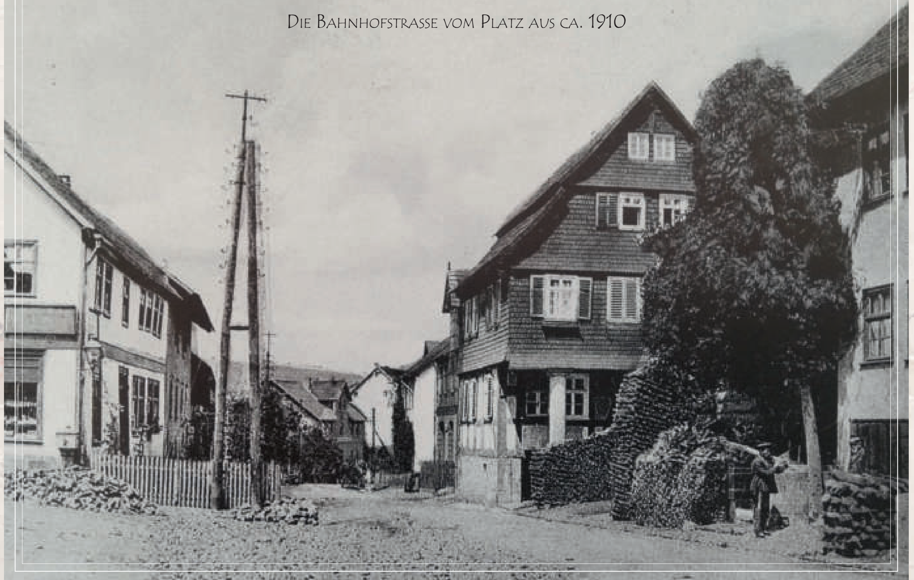
DIE BAHNHOFSTRASSE VOM PLATZ AUS CA. 1910