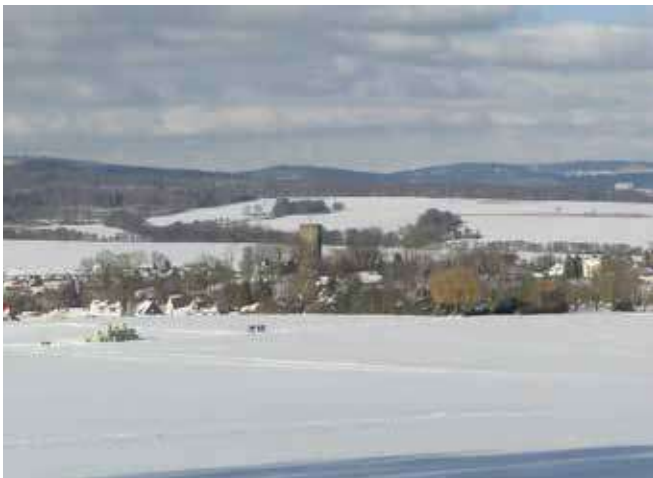
Blick von der Ameisenstraße auf Jesberg

01 02 03 04 05 06 07 08 09 10 11 12 13 14 15 16 17 18 19 20 21 22 23 24 25 26 27 28 29 30 31 MON DIE MIT DON FRE SAM SON MON DIE MIT DON FRE SAM SON MON DIE MIT DON FRE SAM SON MON DIE MIT