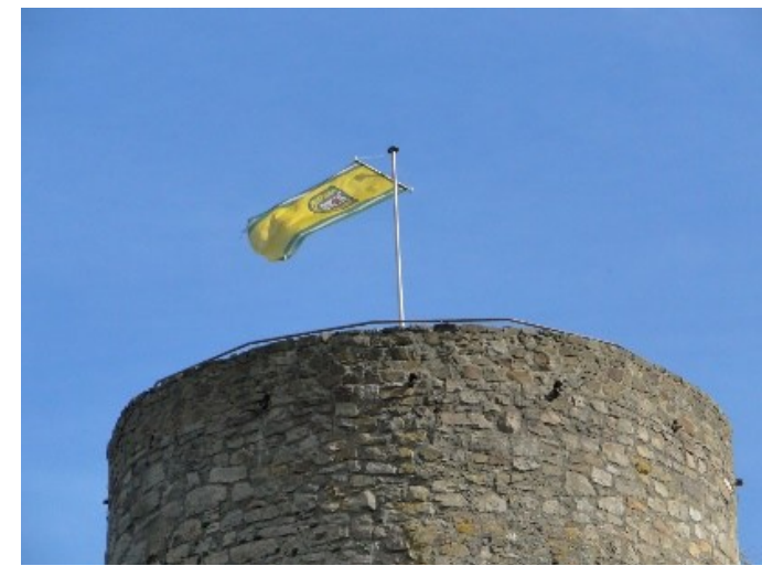
Der Bergfried 1987

Die vom Zahn der Zeit zernagte Ruine konnte von der Gemeinde Jesberg 1964 erworben und von 1980 bis 1987 saniert und restauriert werden.