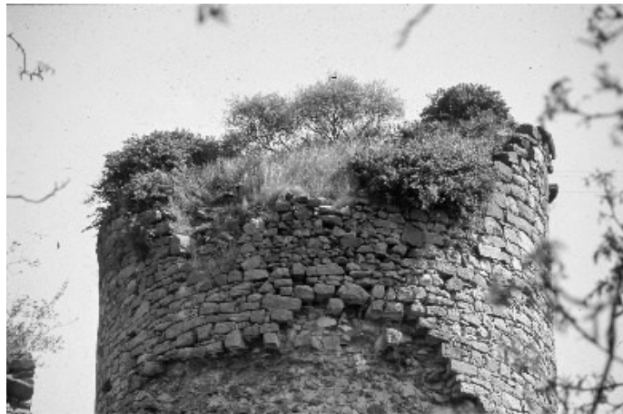
Der Bergfried um 1960

1524 wurde die Burg durch das Erzbistum Mainz erneuert, doch nach einem Vergleich mit dem Landgrafen verlor die Burg an Bedeutung und wurde dem Verfall preisgegeben.